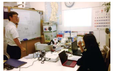
▲ (専門家派遣) PRツール制作のアドバイスなど、出店者ごとの課題を専門家と一緒に解決