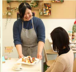
※過去のショップ&カフェの様子