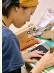
QONOCO (コノコ) 革製品の製作・販売

TRY6の専門家派遣でお店のコンセプトや特徴を一緒に考えてくれてPRツールが完成。今でも活用しています。