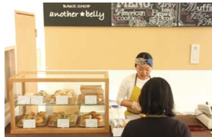
▲ (カフェスペース) キッチンで製造した食品を販売するスイーツショップスタイルでの出店も