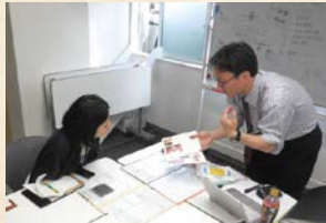
専門家派遣の様子