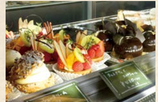
開業した店内には独創的なスイーツが並ぶ