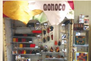
商業施設で期間限定出店中のショップ