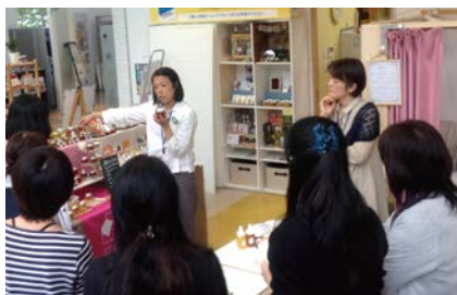
▲ (出店者ミーティング) 店舗運営を円滑に行うために出店者同士のミーティングで連携強化