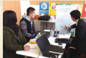
専門家派遣の様子