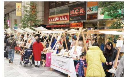
▲ (出張イベント) 新規客獲得に向けて販売イベントにも出展し、自店の魅力を発信強化