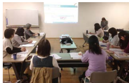
▲ (勉強会) 起業家の心構えから、商品ディスプレイなどの実践講座でスキルアップ