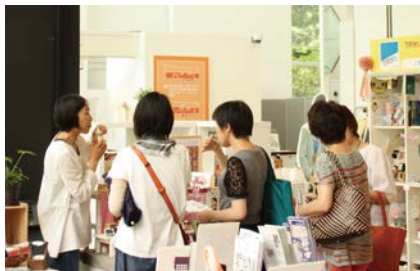
▲ (ショップスペース) 商品販売・サービス提供に加え、ワークショップでもファンづくり