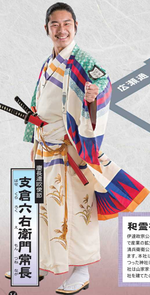
支倉六右衛門常長