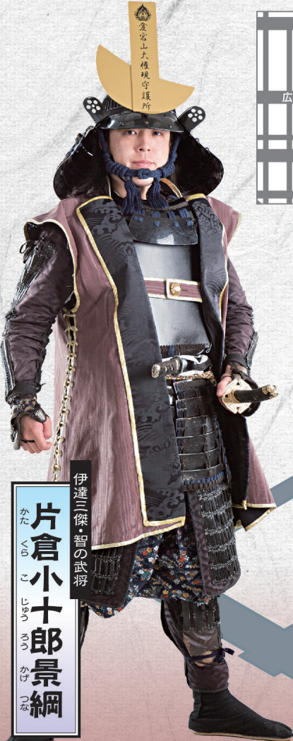
伊達三傑・智の武将 片倉小十郎景綱

どうやらここが地図の場所であるが…なんと、こんなところに『新伝馬町』の由来が示されておる。それでは早速謎を解くことにしよう