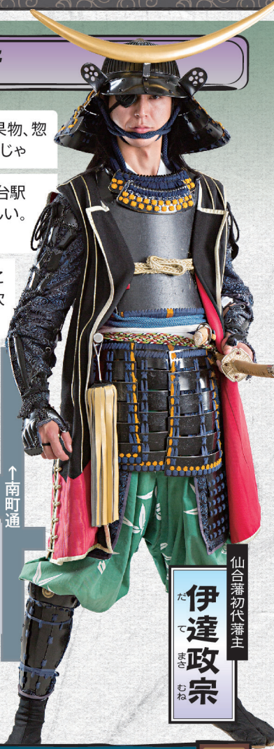
仙合藩初代藩主 伊達政宗